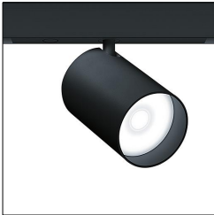
Projecteur d'accentuation à LED SUP2 L LED1250-930 SP LDO BK 42927707