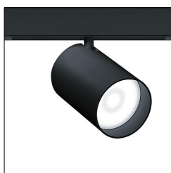
Projecteur d'accentuation à LED SUP2 L LED1250-930 SP LDO BK 42927707

La présente déclaration de produit environnemental (EPD) est basée selon les normes EN ISO 14025 et EN 15804 et décrit les impacts spécifiques environnementaux du produit mentionné. Cette déclaration fait suite également aux exigences spécifiques et concrètes du programme Institut Bauen und Umwelt e.V. (IBU) selon les règles de calcul des LCA et le contenu de l'EPD (de base) selon les instructions de PCR sous-jacentes (PCR: Règles de catégorie de produit) pour «Luminaires, lampes et composants pour luminaires» (Ref: IBU PCR Teil A et B). Le produit décrit sert d'unité déclarée. La déclaration inclut une description du produit, des informations sur la composition des matériaux, la production, le transport, la phase d'utilisation, l'élimination et le recyclage, ainsi que les résultats de l'évaluation du cycle de vie. Les EPD des produits de construction sont comparables uniquement si les valeurs sont calculées conformément au même PCR et des scénarios d'utilisation appropriés et obligatoires.