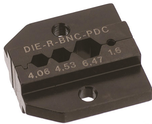
MACHOIRES NEUTRIK : DIERBNXPDG