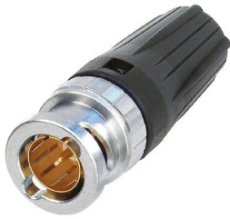
Neutrik BNC : NBNC75BLP9