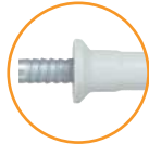
Version douille fraisée