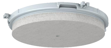
Couvercle à percer en fibre minérale