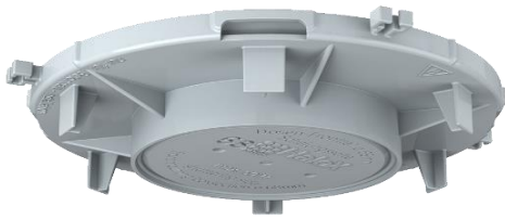
Couvercle avec diamètre prédéfini