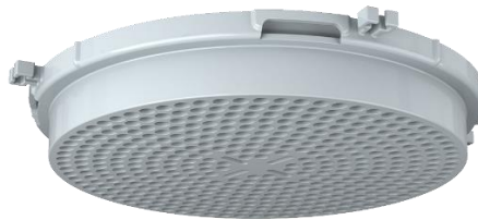
Couvercle à percer