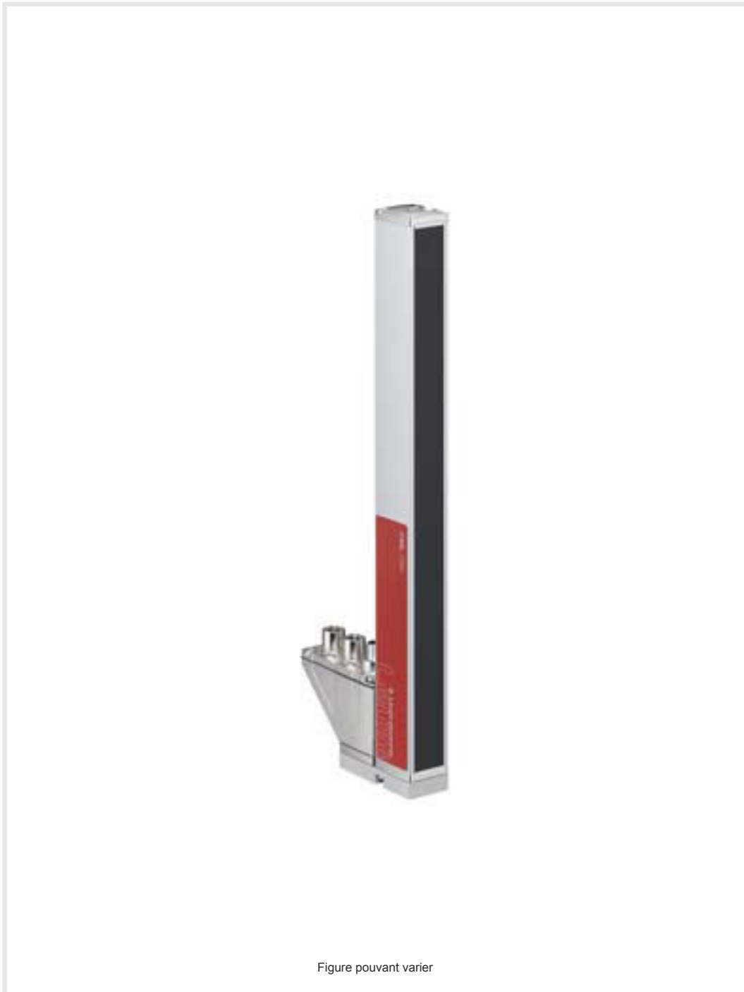
Figure pouvant varier