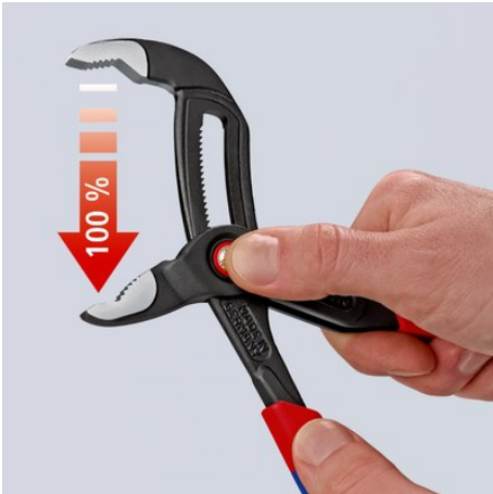
Appuyer sur le bouton – ouvrir intégralement la pince