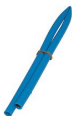
EI 5 TF