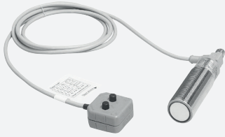
Appareil de programmation