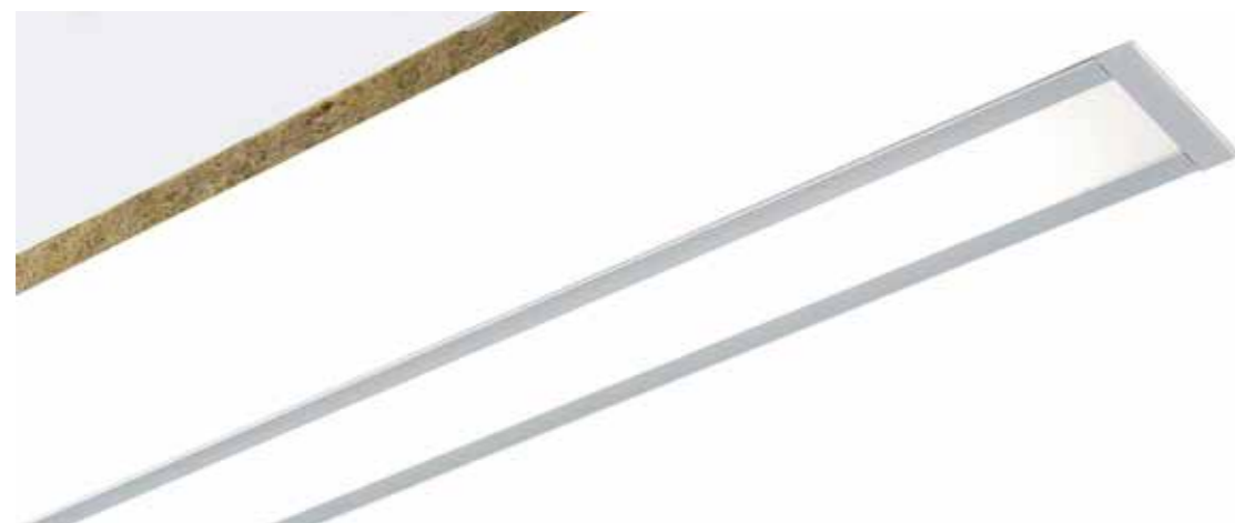
Angle avec diffuseur opale

• J+3 J+7 voir conditions, prix et délais pages 20-21.