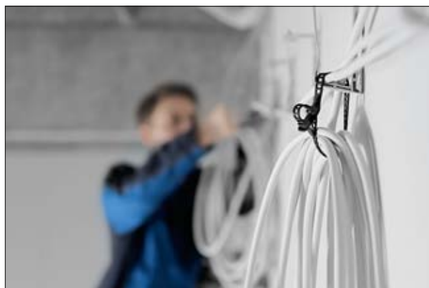
Colliers SOFTFIX disposant d'une grande élasticité en application.

i Avec une 2ème boucle pour des faisceaux en parallèle !