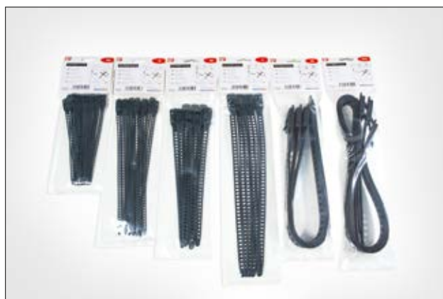
Colliers SOFTFIX, en conditionnements réduits.