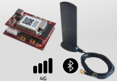
MODULE MOBILE + ANTENNE + SIM