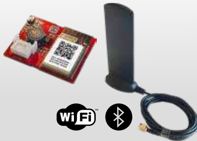
MODULE WI-FI + ANTENNE