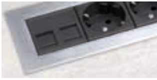
Chrome Acier Poli (KSF13X /8)