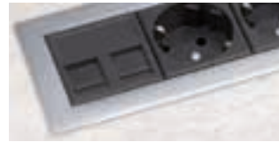
Acier mat Sur demande