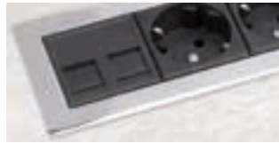
Acier chromé Sur demande