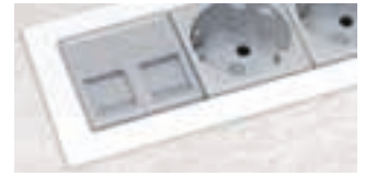
Option couleur personnalisées Sur demande ■ ■ ■ ...