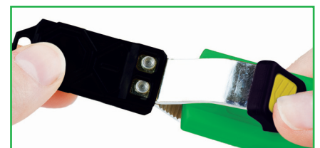
Capuchon de sécurité clipsable