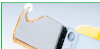
Lame traitée au nitrure de titane