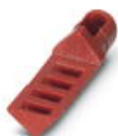
Profilé de détrompage pour boîtier HC-MOD-K...