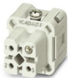
Isolant femelle HEAVYCONNEX, série A3, 3 pôles, raccordement vissé sans protection du fil

Remarque : les données indiquées ici sont tirées du catalogue en ligne. Vous trouverez toutes les informations et données dans la documentation utilisateur. Les conditions générales d'utilisation pour les téléchargements sur Internet sont applicables. ( http://phoenixcontact.fr/download )