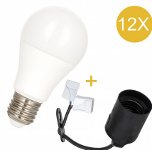
144919 12-Pack Combi E27 LH Connector + LED 6W 4000K