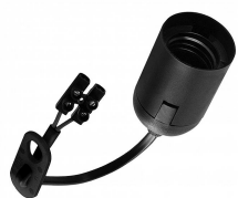
140215 Renovation Douille E27 TP Noir 2x0.75mm 2 15cm