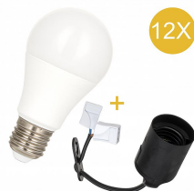
145057 12-Pack Combi E27 LH Connector + LED 6W 2700K