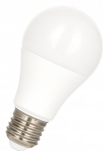
80100040022 LED Ecobasic A60 E27 10W (68W) 935lm 840 Opale