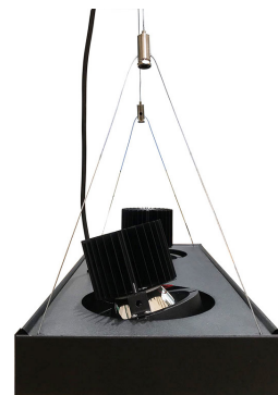
Système de suspension avec fils en triangulation réglable.