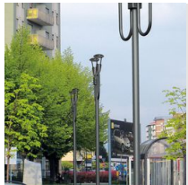
1491 Mât à enterrer