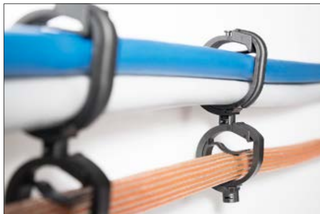
Agrafes de la série IAHC interconnectées entre-elles, pour un routage en parallèle.