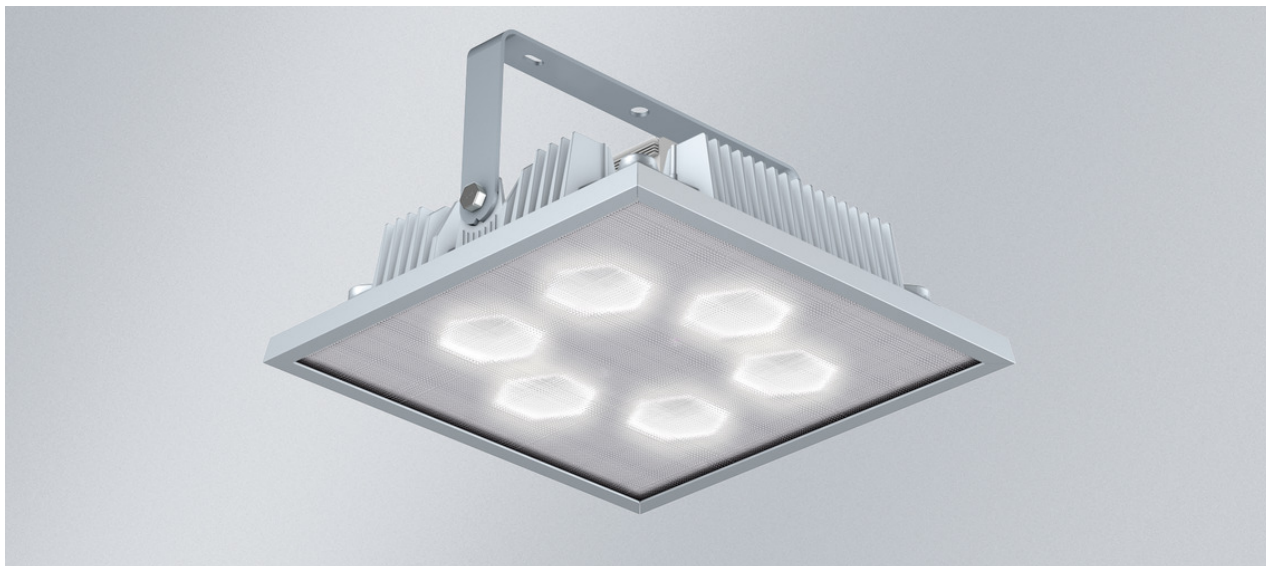
L'illustration peut différer