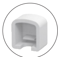
8 embouts percés