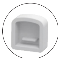
8 embouts non percés