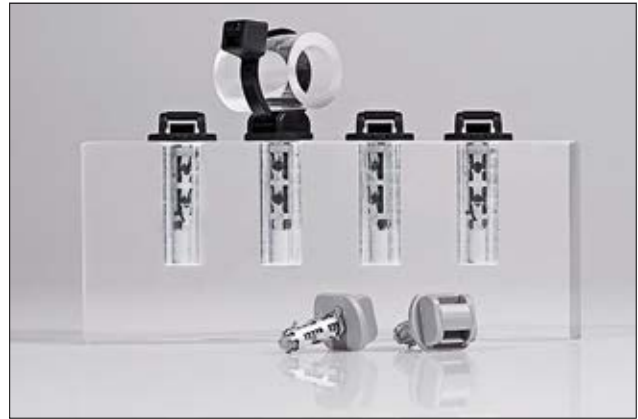
Lanières assemblées de la série DHA.