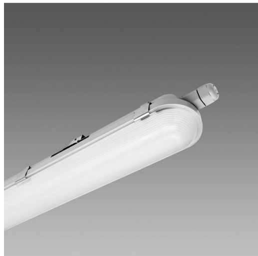
1782 Roda - mono