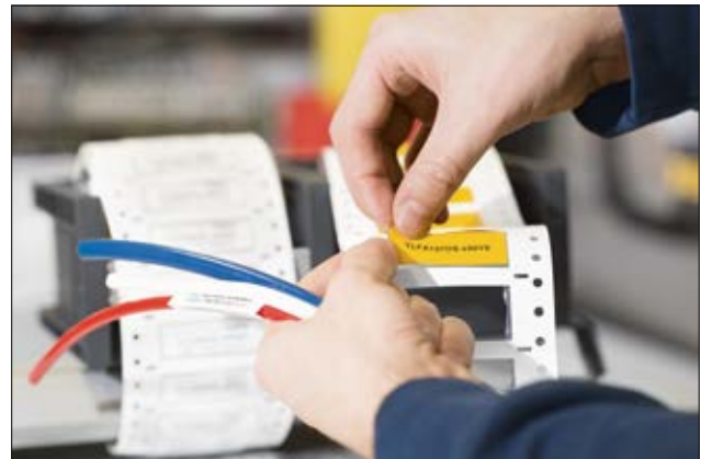
Marqueurs agréés pour le manchon thermorétractable TLFX DS.