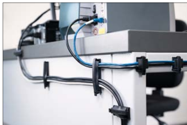
solution parfaite pour router des câbles le long d'un bureau