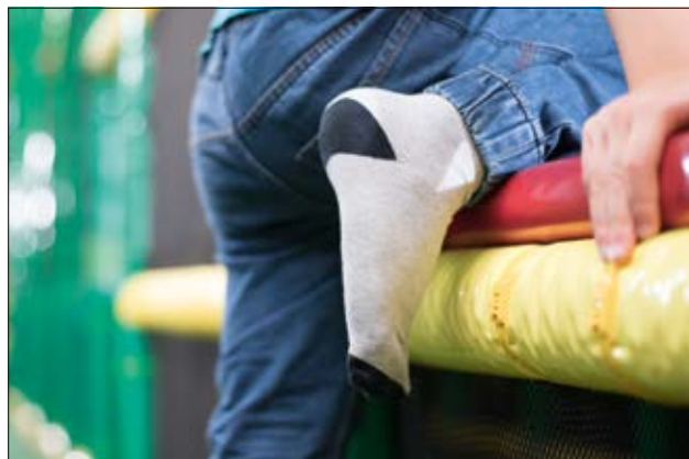
Série PE - Les colliers de serrage à tête plate minimisent le risque de blessure et en même temps évitent d'endommager les câbles.