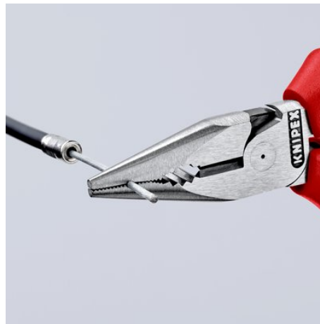
Rainurage fraisé dans la zone de saisie