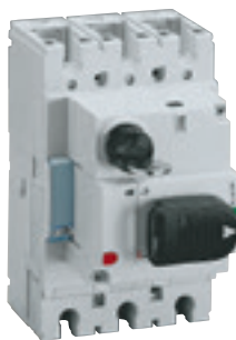
4 210 00