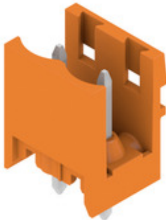
Illustration du produit