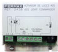
F02438 ACTIVATEUR SONNETTE OU ECLAIRAGE VDS