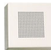
F02040 PROLONGATEUR APPEL ÉLECTRONIQ.