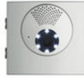
F73911 AMP. VID. DUOX PLUS SKYLINE W