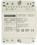
F04802 ALIMENTATION DIN4 230VAC/12VAC-1A