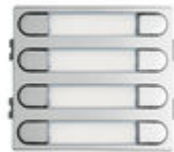
F07371 8 BP. 204 W VDS/BUS2 SKYLINE