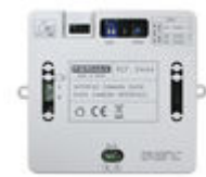
F09444 INTERFACE CAMÉRA DUOX PLUS