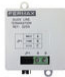
F03255 FIN LIGNE DUOX PLUS