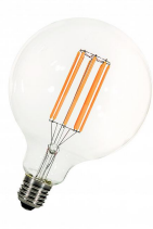
80100036367 LED FIL WarmDim G125 E27 6W (50W) 640-120lm 927-919 CL