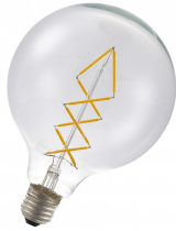
143573 SPIRALED Basic G125 E27 DIM 4W (28W) 300lm 822 Clair