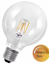
80100040293 LED FIL WarmDim G125 E27 6W (50W) 640-120lm 927-919 CL