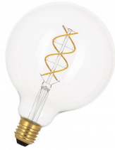
144339 SPIRALED William G95 E27 DIM 3.2W 190lm 922 Clair