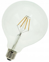
142589 LED FIL G125 E27 DIM 4W (35W) 400lm 827 Clair