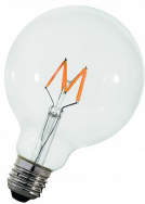
80100036458 LED FIL Wave G95 E27 DIM 3W (22W) 220lm 922