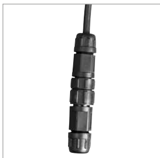
connectiques mâle & femelle IP 68 pré-installées