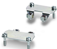
Kit d'adaptation, type: D25

Veillez tenir compte du fait que les données affichées dans ce document PDF proviennent de notre catalogue en ligne. Vous trouverez les données complètes dans la documentation utilisateur. Nos conditions générales d'utilisation des téléchargements sont applicables.