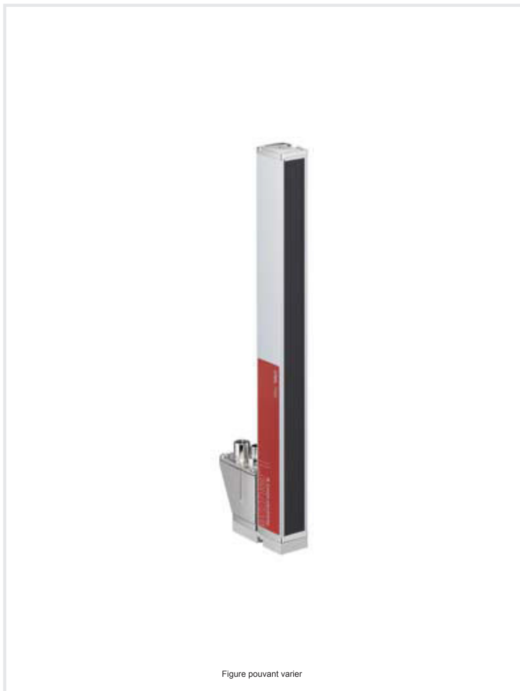
Figure pouvant varier