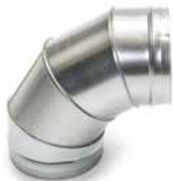
Coude 90° secteur

Le coude 90° permet de changer la direction d'un réseau galvanisé de 90°.