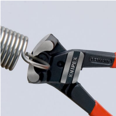
Capacité de coupe élevée, même avec de la corde à piano