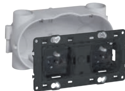
0 819 42 avec prises précâblées réf. 0 671 22