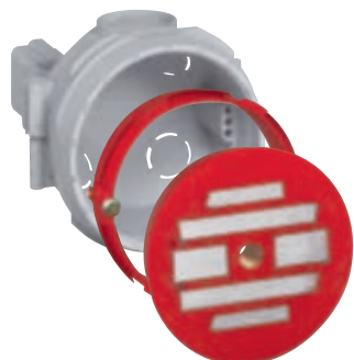
0 819 41 + 0 819 60 + 0 819 90