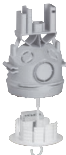
0 819 41 + 0 895 92