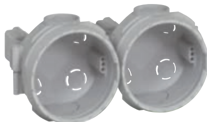
0 819 41 x 2