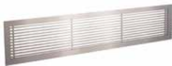
Grille Gridlined wall

La grille murale intérieure fixe en aluminium GRIDLINED Wall est destinée au soufflage et à la reprise de l'air dans les bâtiments tertiaires.