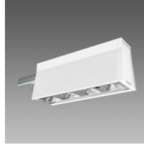
Sintesi Spot - UGR<22 - module lumineux