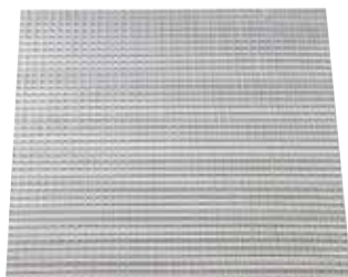
AO123Z FO 1198X598 RAL9010std

La grille de plafond en aluminium AO 123 permet la reprise d'air dans un local pour des installations de ventilation ou de conditionnement d'air.