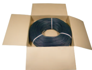
couronne (emballage standard)

Autres dimensions : prix et délai sur demande. Nous consulter.