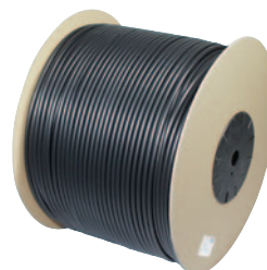
toret (sur demande)