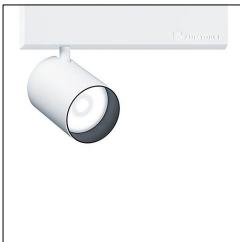
Projecteur d'accentuation à LED SUP2 M LED550-930 WFL DIM 3CV WH 60714943