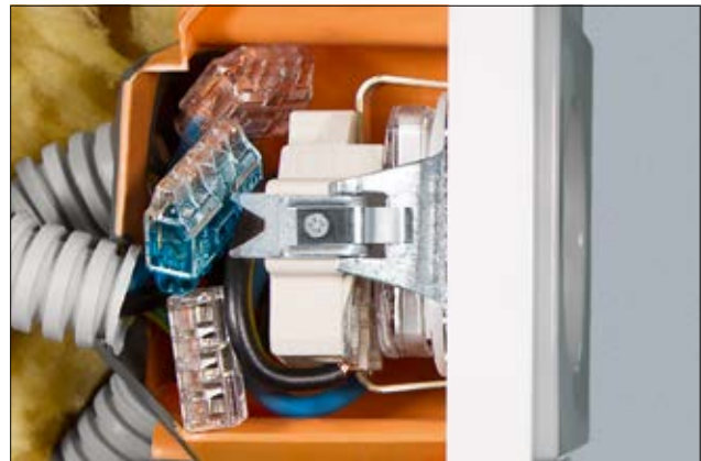
Bornes de raccordement HelaCon Plus Mini - S'adapte parfaitement à toutes les situations où l'espace est limité.