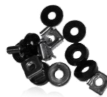
Kit vis écrou-cage Screws and floating nuts kit Ref. 13P1552023 - Ref. 13P1552024