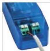
double bornier automatique