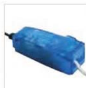
capot à clipsage rapide