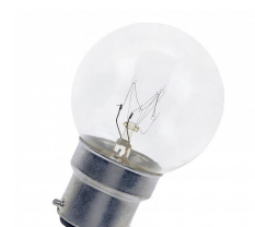
KB275240007 Sphérique B22d G45 240V 7W Clair