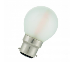
80100039002 LED FIL G45 B22d 2W (22W) 210lm 827 Dépolie