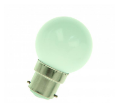
80100034045 LED Party G45 B22d 1W 70lm 828