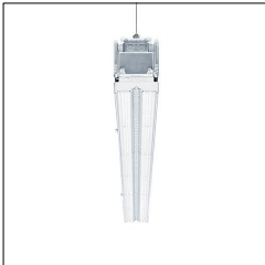
Réglette à LED pour chemin lumineux TECTON C LED3700-840 L1000 WB LDE WH 42183293