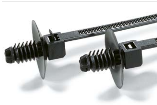
Ces lanières conviennent aux panneaux de grande épaisseur.