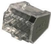
Bornes de connexion - Connecteur standard (8 entrées)