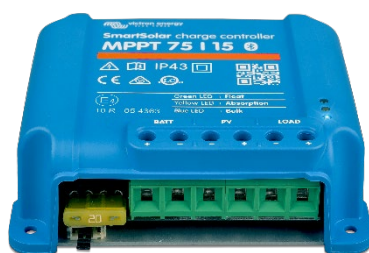
Contrôleur de charge SmartSolar MPPT 75/15