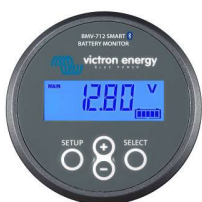
Détection Bluetooth BMW-712 Smart Battery Monitor