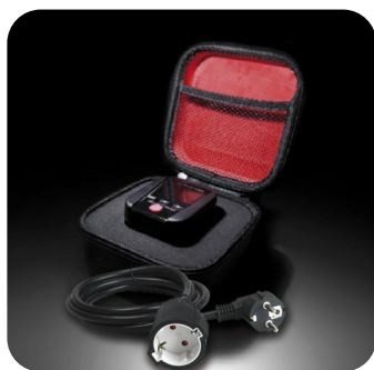
Livré avec étui rigide et prolongateur

Accessoire optionnel : SA165 : kit de mesure pour tableaux électriques